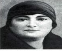
MEHMET AKİF ERSOY