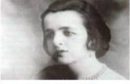
ALİ RIZA EFENDİ