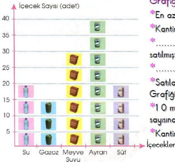
Grafik: Okul Katininde Satılan İçecekler

** Aşağıda Cumhuriyet İlkokulu kantininde satılan içeceklerin sayısı şekil grafiği ile verilmiştir,