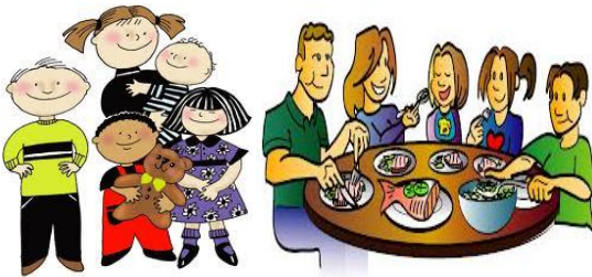
Ali ' nin ailesi